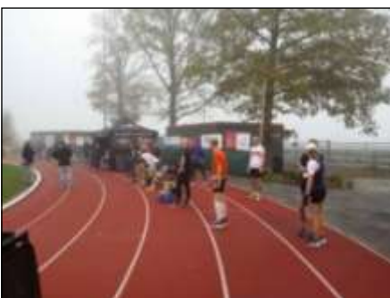
Toch een beetje onwennig om me heen kijken