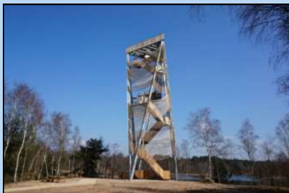
Grenzeloze Tocht op 28 december: een vooruitblik