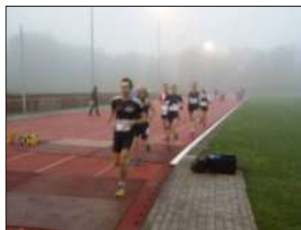
Ik wandel ergens achter in de mist, gok ik